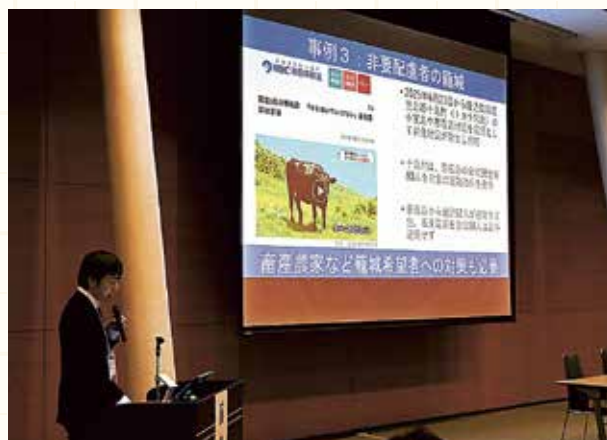
第84回 日本公衆衛生学会総会シンポジウムにて (2025/11/05 静岡新聞より)