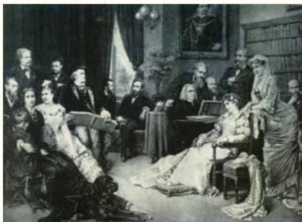
図139 バイロイトのワーグナーの自宅，バーンフリード，1882 リストとその後部のハンス・リヒター，リストの義理の息子・ワーグナー，リストの二女・コジマと孫・ジークフリード（左下）