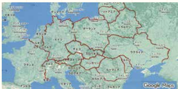
図130 現代のヨーロッパ地図 (googlemap) ポーランドと周囲各国のおおよその位置関係を確認

それがショパンの人生と音楽を知る上で、重要な助けになるものと、思われるからである。