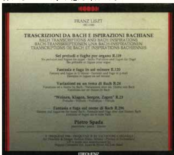
図137 リストがバッハに靈感を得て作曲、編曲した5曲。第1曲目の「6つのプレリュードとフーガ」だけでも演奏時間は70分の大作

第1曲目の「 6つのプレリュードとフーガ 」だけでも、演奏時間は70分を要する大曲であり、この中の「 第1番イ短調 」を聴いただけで、リストが バッハの神髄 を、確実に我が物にしていた事が感じ取れる。