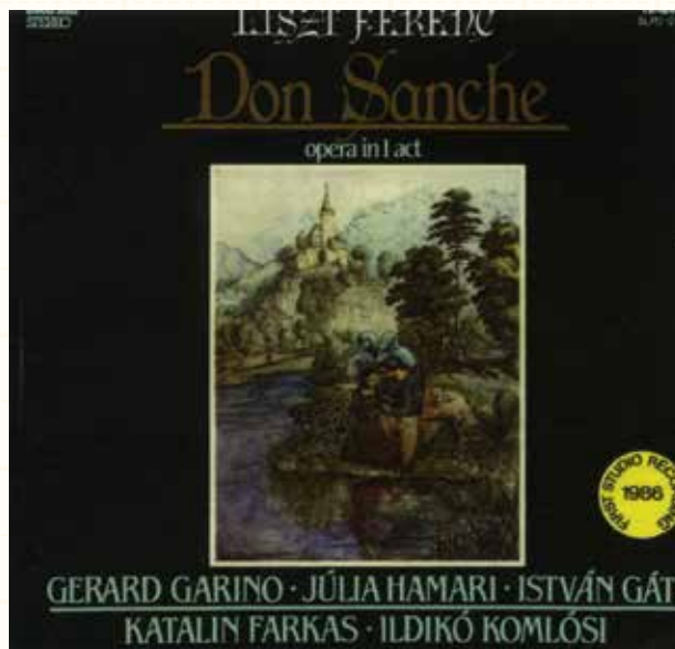
図135 14歳のリストのオペラ「ドン・サンショあるいは愛の城」, (名ヴァイオリニスト・クロイツェル指揮, パリ・オペラ座)

1825年, 14歳のリストはパエールの助けを借りて, パリ・オペラ座で音楽監督・クロイツェルの指揮で, オペラ「ドン・サンショ, あるいは, 愛の城」を初演した(図 135)。