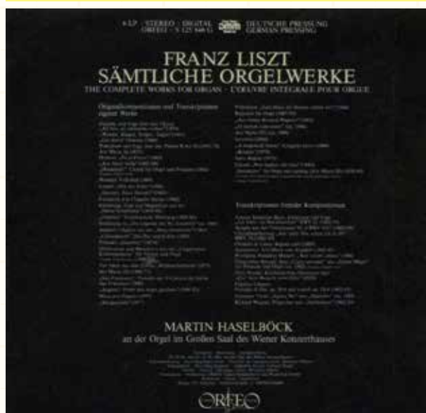
図138 リストの約60曲から成る「オルガン全集」6LPから成る膨大な作品群。ショパンの前奏曲（プレリュード）も2曲ある

この全集の中に、ショパンの「 前奏曲、作品28の第4番、第9番 」の2曲が入っている事は、リストのショパンに対する思いやりと見るべきだろう。