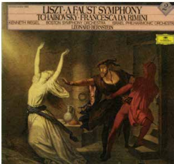
図133 ゲーテのファウストによる「ファウスト交響曲」, ベルリオーズに献上 (バーンスタイン指揮, 1977)

図は、文学を主題とした、「ファウスト交響曲」, 「ダンテ交響曲」(図 133,134)。