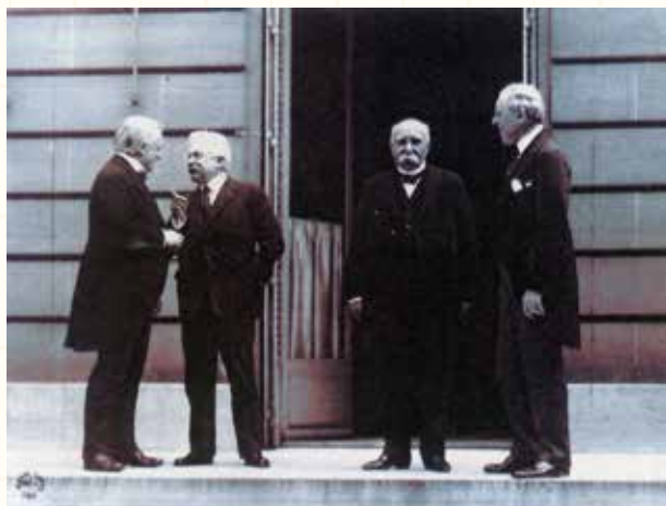
図132 パリ講和会議, 1919 左からロイド・ジョージ(英), オルランド(伊), クレマンソー(仏), ウィルソン(米)

さて第28代アメリカ大統領・ウィルソンの提唱した「14ヶ条の平和原則, 1918」の第5条は、 民族自決 を提唱し、第1次世界大戦後に、 ヴェルサイユ宮殿で調印された「ヴェルサイユ条約, 1919」 で、 ポーランドとチコスロバキアの独立が確定した (図132)。