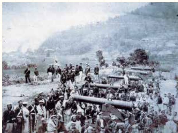
図129 第2次下関戦争, 1864 英・米・仏・蘭の四ヶ国軍に占拠された前田砲台、数門の大砲は、おみやげに持ち去られる

巨額の賠償金、軍備の弱体化(砲台撤去)などで身ぐるみ剥がされた長州藩に、連合軍の更なる要求が突きつけられた(図129)。