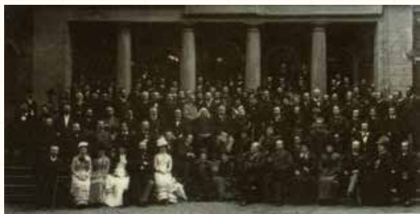
図140 リストの赴く所，弟子，信奉者有り リストは死ぬまで，演奏，作曲，弟子の教育，旅行をやめなかった（写真中央，白髪の高長髪）。 写真は死のわずか2ヶ月前，1886年6月5日