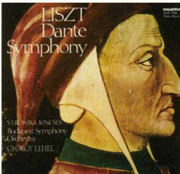
図134 ダンテの神曲による「ダンテ交響曲」, ワーグナーに献上 (レエル指揮, 1978)

1825年, 14歳のリストはパエールの助けを借りて, パリ・オペラ座で音楽監督・クロイツェルの指揮で, オペラ「ドン・サンショ, あるいは, 愛の城」を初演した(図 135)。