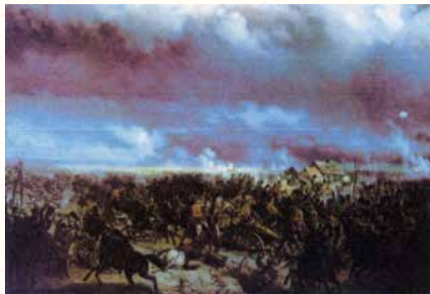
図131 9ヶ月間激戦が続いた「ワルシャワ11月革命」数万人が死亡、数万人が難民となる