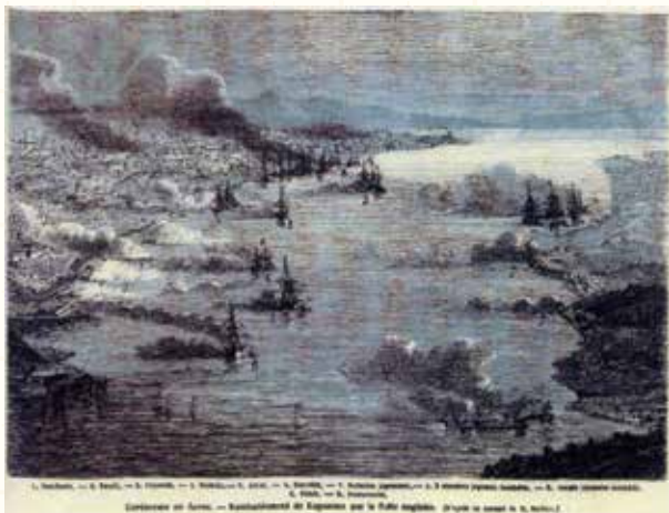
図128 薩英戦争, 1863 世界最強の大英帝国海軍を撃破・退却させる薩摩藩、「やればできる！」

女真族による「 刀伊の入寇,1019 」、鎌倉時代中期のモンゴル帝国による、2度の「 元寇,1274,1281 」、近くは大英帝国による「 薩英戦争,1863 」である(図128)。